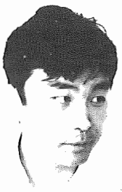
あびこエコーズを率いてママさんコーラス全国大会へ

心、お母さんへの寄せた言葉は絶大。全国大会は間に迫ったが、「賞とり」という気はありませぬ。心をひとつにしていい歌をかせたい。気負いもなく淡々と、大会には、ママさんコーラスでは珍しいフランス語とラテン語の歌を聴け「自分の趣味を押しつけた」とおっしゃるが、メンバーは「世界が広がったみたい。難しいけどやりがいがあります」と意欲満々。