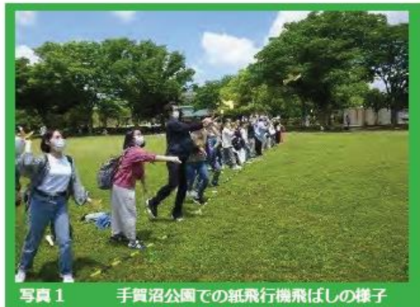
写真1 手賀沼公園での紙飛行機飛ばしの様子