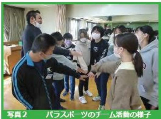
写真2 パラスポーツのチーム活動の様子

令和2年9月に、5名の受講者が参加してリズム遊びを行うことからスタートしました。令和3年度からは活動を広げ、クッキー作り、ゴールボールなどのパラスポーツやダンス、リズム遊び、落語や音楽鑑賞等も行っています。受講者も次第に増え20名前後が毎回参加するようになりました。土曜日の午前中に開催していること、受講者が興味のある活動を選べることはもちろん、川村学園女子大学の学生がともに活動しながら支援にあたっていることが、受講者の励みになっているようです。毎回の活動後には、学生とともにスタッフが振り返りを行い、よりよい支援や運営のために意見を出し合っています。