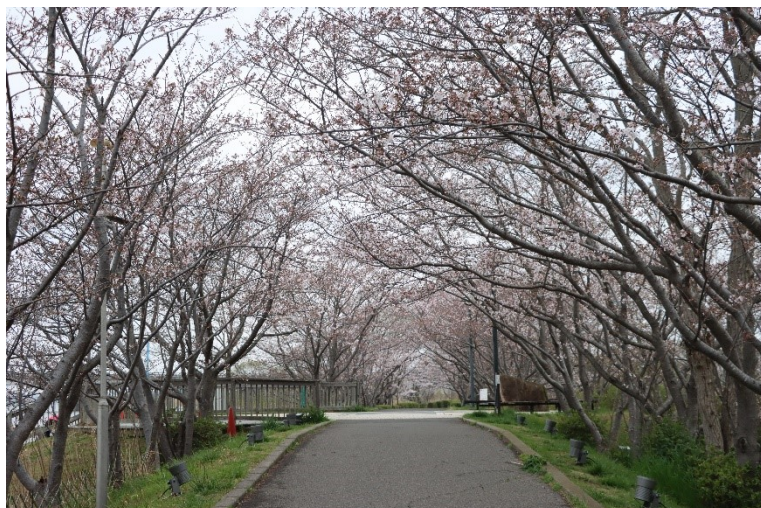
▲2024年4月5日現在の桜（三分咲き程度）