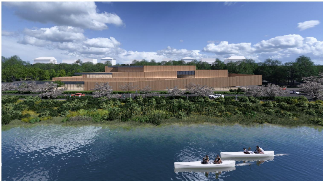
湯浴施設イメージパース

※配置図・立面図、イメージパースは提案段階のものを基本としていますが、今後の土地売買により一部変更の可能性を含むものです。また、今後、景観アドバイザー相談や周辺住民説明、開発行為に伴う事前協議などにより変更が生じる可能性もあります。