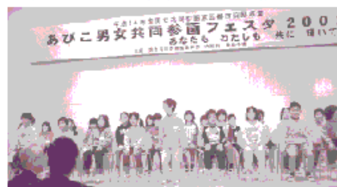
我孫子第三小学校4年生の皆さん

子どもたちの持っている資質や個性を伸ばすために、もう一度、家庭や地域の“男はこうあるべき、女はこうあるべき”という見方や思い込みを、ちょっと疑ってみませんか。注意してみませんか。これだけでも子どもへの対応が大きく変わっていきます。「自分らしさ」を大切にすることの重要性について親子で話し合ってみましょう。