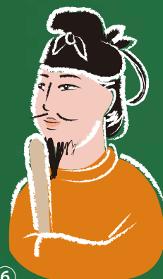
⑥ 推古天皇の下で 十七条憲法制定 遣隋使派遣など 「和を以て貴しとなす」