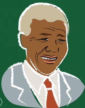
① 南アフリカ共和国 元大統領 反アパルトヘイト運動 ノーベル平和賞受賞