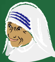
③ 子育ては 人を育てる