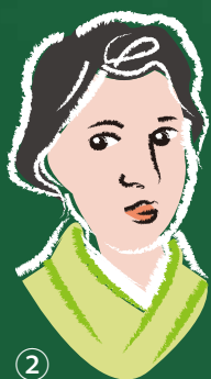
② 女性解放運動の指導者 「元始、女性は太陽であった」