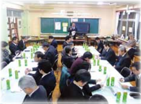
我孫子市PTA連絡協議会の理事会

女性が多い身近なグループと言えばPTA。役員のはほとんどは女性ですが、会長を務めるのはなぜか男性が多く、我孫子市内の小・中学校でPTAのある18校のうち、女性会長は1校だけ。女性役員の中に男性会長ただ一人という学校もあります。そこでPTA会長有志にお集まりいただき、会をまとめる胸のうちを伺いました。