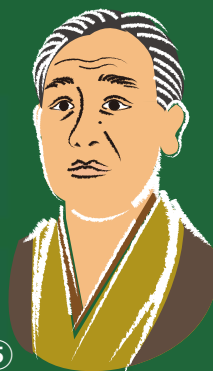
⑤ 慶應義塾大学を創設 「天は人の上に人を造らず、 人の下に人を造らず」