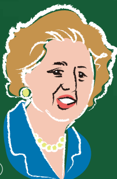
④ イギリス初の女性首相 「鉄の女」と呼ばれた