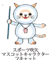
スポーツ吹矢 マスコットキャラクター フキヤット