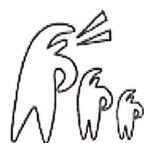
NPO 法人我孫子市体育協会