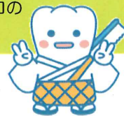
日本歯科医師会 PRキャラクター よ坊さん