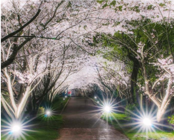
手賀沼遊歩道桜ライトアップ(春)

ここはかつて文人たちに愛された憩いの郷、『物語の生まれるまち あびこ』。年間を通じてさまざまなイベントが行われ、たくさんの人々で賑わいます。歴史を感じたり、自然に触れたり、ぶらり散策してみませんか。都心から電車で35分の自然豊かなまちに是非お越しください。