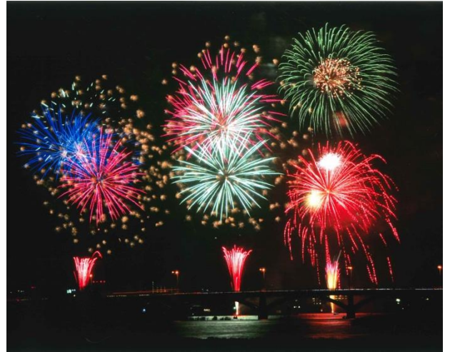
手賀沼花火大会(夏)