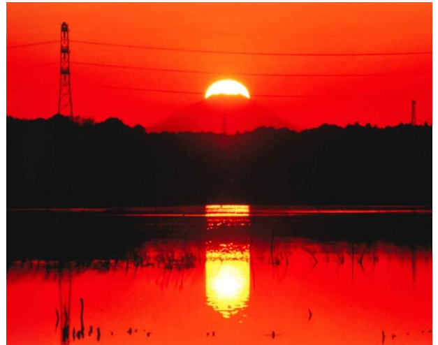
ダイヤモンド富士(冬)