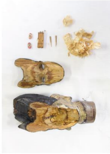
頭部の解体（玉眼抑えは「おが屑」）