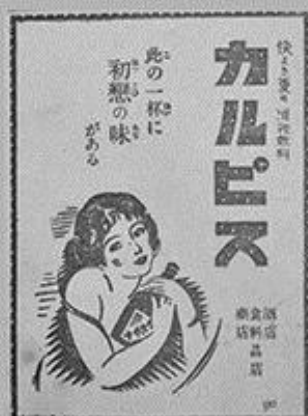
当時は新新だった 「初恋の味」のキャッチコピー 大正12年の『アサヒグラフ』