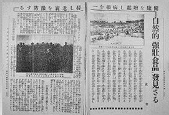
カルピスの前身商品「醍醐味」の記事(複写) 『実業之日本』掲載