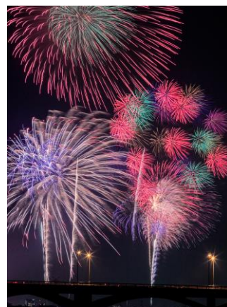
毎年恒例となった手賀沼花火大会