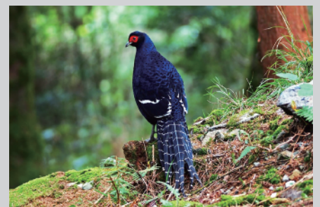
台湾の固有種 ミカドギジ

【協力】浅野利幸、我孫子野鳥を守る会、池田日出男、(株)エコリス、奥村みほ子、川上和人、森森亮、佐藤文男、森林総合研究所、久野誠一、藤田宏之、丸嶋紀夫、公益財団法人山階鳥類研究所、林憲文、渡辺俊文、(五十音順、敬称略)