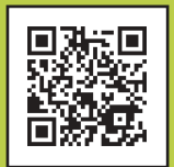
スポーツエントリー