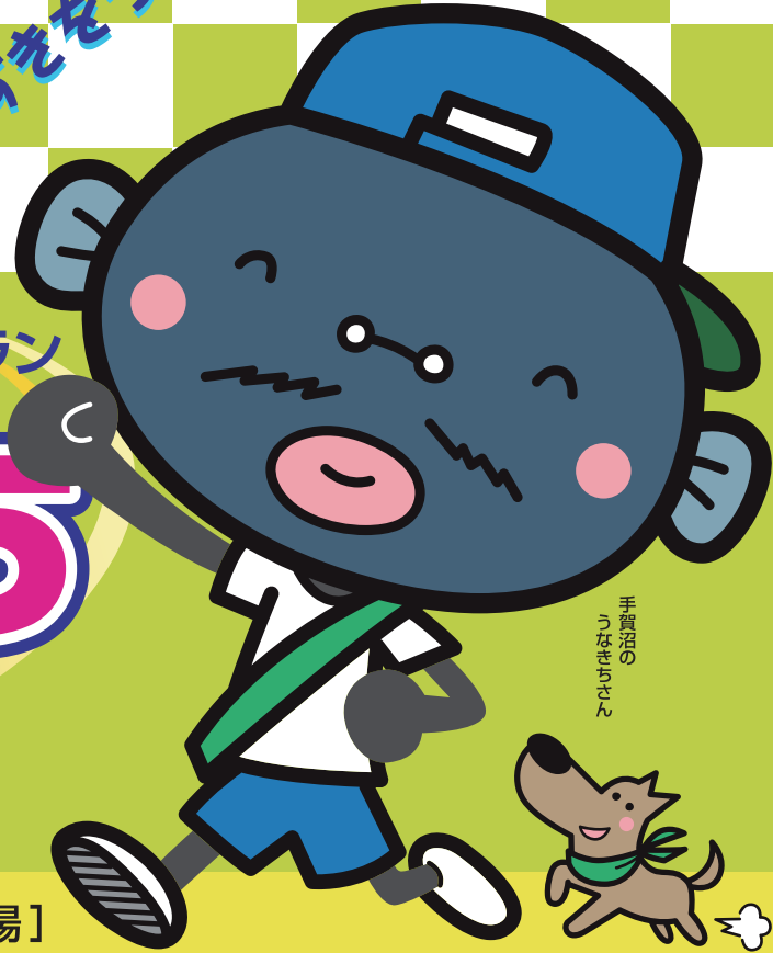
手賀沼の うなきちさん