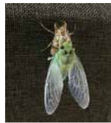
セミの幼虫の姿(抜け殻)と成虫の姿