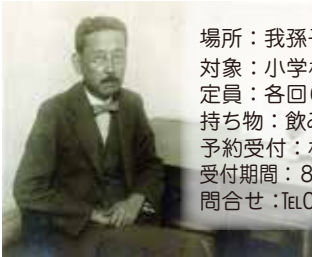
杉村楚人冠肖像写真