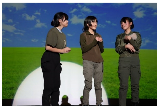
▲令和5年の演劇の様子

戦争を知らない現代の子どもが悲惨な戦争の時代を生きたら…。戦時中の子どもが物の豊富な現代を生きたら…。戦争、平和、そして今を生きるとは。