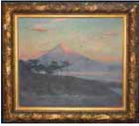
和田 栄作《富士山》

開 館：9:00～16:30 (入館は16:00まで) 休館日：月曜 (祝日の場合は翌平日) 所在地：千葉県我孫子市緑2-5-5 TEL：04-7187-1131