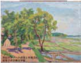
原田 京平「ハケの道と手賀沼3」

期 間：開催中～2月24日㊄・㊅ 時 間：9:00～16:30 (入館16:00まで)