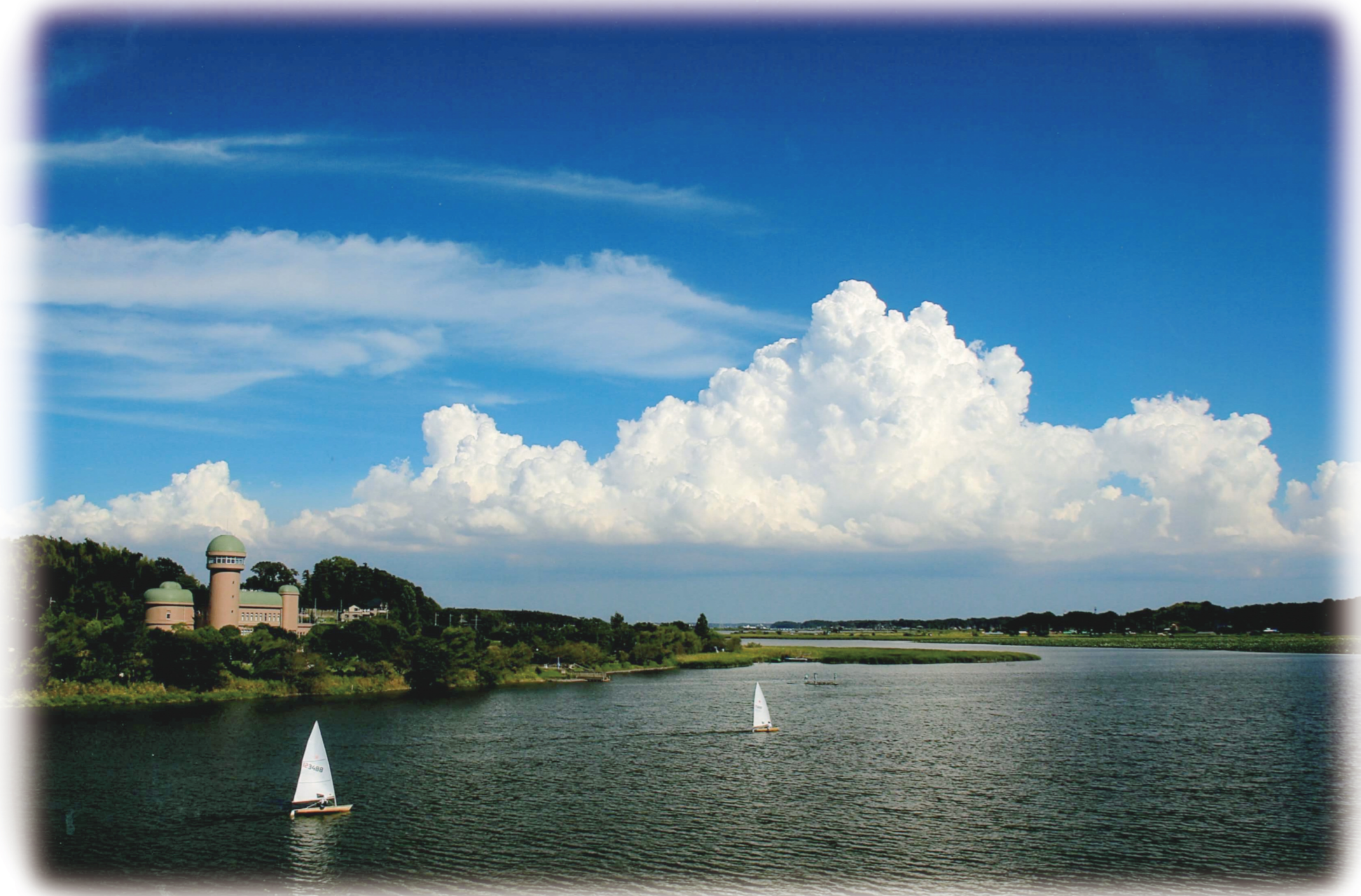
「9月の碧い空」 撮影：栗城静夫 手賀沼写真コンクール作品より